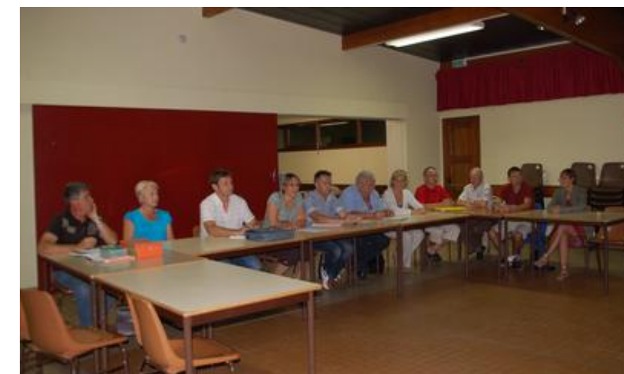
Assemblée Générale du Club